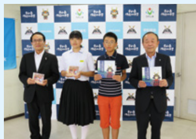
絵本とCD贈呈式（宇和島市教育委員会）