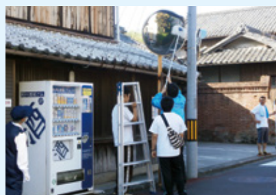
カープミラー清掃活動