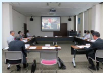
第5期 年金モニター会