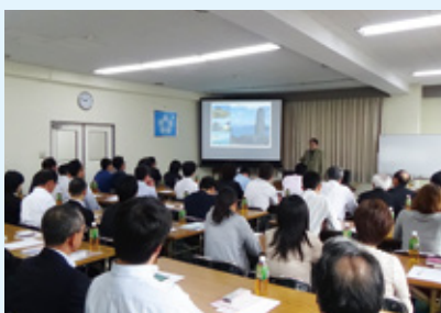
若手経営塾OB会 講演会