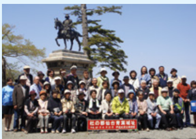
年金友の会旅行（仙台2泊3日の旅）