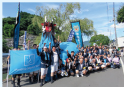
うわじま牛鬼まつり 2015