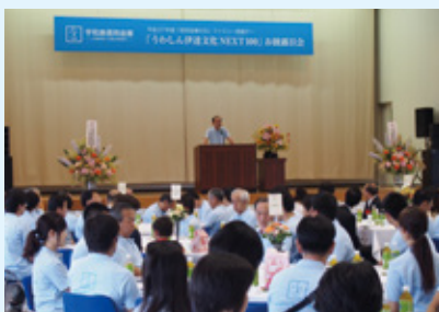
「信用金庫の日」ファミリー感謝デー